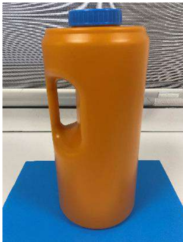
● Grasa en heces ( 72 )