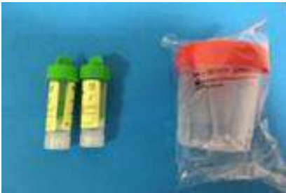
● Parásitos en Heces