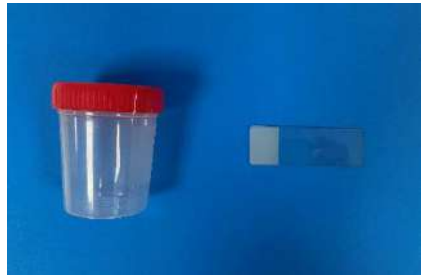
● Test de Graham