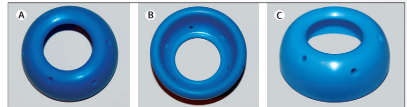
Figure 1: Photograph of the silicone cervical pessary (A) Inner diameter. (B) Outer diameter. (C) Lateral view.